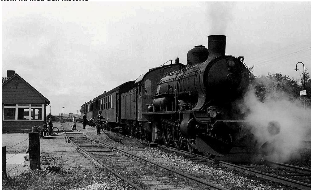
Her holder P916 med persontog 52 Korsør-København ved Svendstrup Station. Året er 1958.

Vi vil meget gerne have noget "lokalhistorie" på vor hjemmeside. Ligger du inde med billeder og en god historie fra din tid herude, så hører vi gerne fra dig. Det tekniske og det med at få historien skrevet hjælper vi dig gerne med. Kom nu ud af busken.